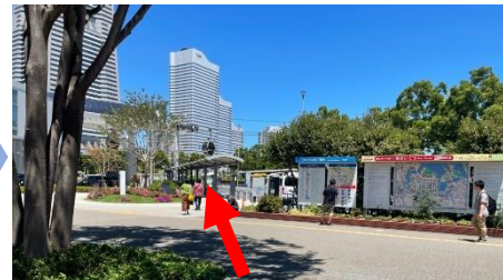
③公共バスのご案内板を正面にして更に左奥のロータリーへ