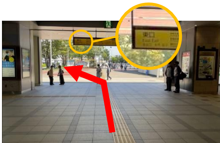
①桜木町駅 南改札より出て左折、東口より広場に出て左奥へ進みます