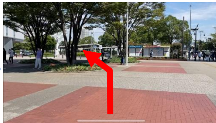
②広場を横切りながら左奥へ