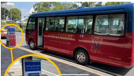
⑥到着！ 左の看板が目印です