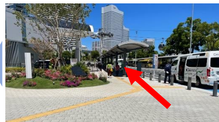
④ロータリーを奥に進みます

※交通状況に伴い、バス停留場所が多少ずれる場合がございます。上図の看板を目印にお待ちくださいませ